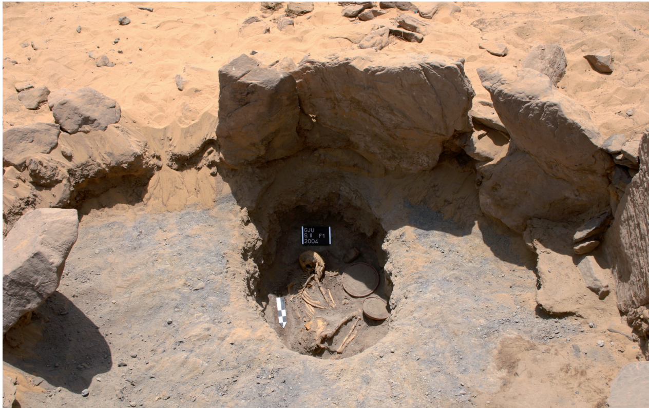
Fig. 5. Une tombe intacte de l'époque prédynastique, plus précisément de la phase Nagada II, a été retrouvée par hasard en 2004 durant les fouilles menées à el-Hosh. Elle peut être datée vers 3500-3400 avant notre ère.

Néanmoins, le site de Gebelet Youssef réservait encore quelques surprises. Ainsi, à l'extrémité méridionale de la colline, plusieurs constructions circulaires, aux parois constituées d'un amoncellement rudimentaire de pierres, avaient été observées. Les céramiques grossières mises au jour dans ce secteur tendent à démontrer que ces installations de fortune étaient probablement l'œuvre de bédouins. Leur fonction originelle, de même que leur ancienneté, restent inconnues mais l'existence de sols en terre battue et d'importantes quantités de paille suggèrent qu'à une époque plus récente, ces structures ont pu être utilisées comme étables. Au plus grand étonnement des archéologues, une sépulture intacte, profondément creusée dans la roche, fut repérée sous l'une de ces structures. La sépulture date à l'évidence